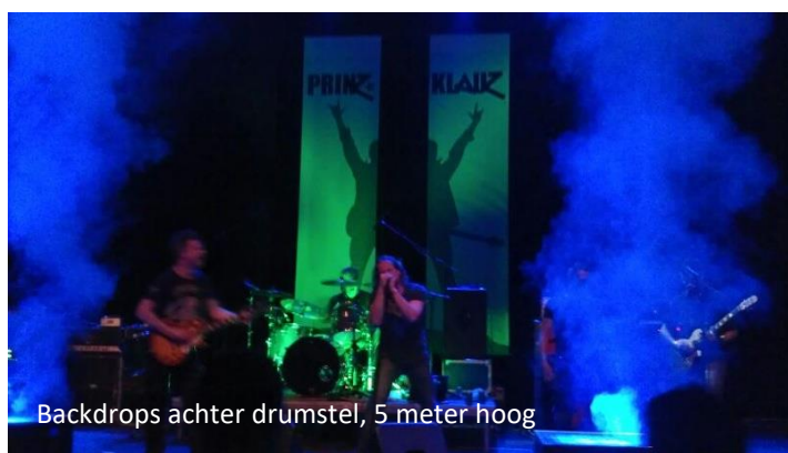
Backdrops achter drumstel, 5 meter hoog

Prinz Klauz brengt twee smalle back drops (3125cm breed, 500cm hoog) mee die links en rechts van de drum riser tegen de achterwand komen hangen. Graag een goed toegankelijk ophangstelsysteem voorzien, dat een snelle ombouw mogelijk maakt. Een mobiele ophangstang, die kan zakken, is erg praktisch.